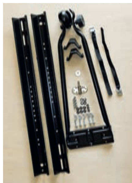
Fietsgoten met steun kiezen we van een algemeen verkrijgbaar merk. We betalen € 29,95 per stuk

dan werkt dat gewicht tegen je. Daarom zetten wij de fietsen dus netjes binnen. Afhankelijk van de indeling is dat overigens niet altijd even gemakkelijk, soms zelfs onmogelijk. Al laten sommige lezers ons weten dat ze fietsen zelfs door een groot raam liggend op bed vervoeren. Wij doen het liever staand in het gangpad, zonder extra afspanpunten te plaatsen. Vier kleine gaatjes onderin het meubelwerk voldoen. Voor meer informatie over deze en eerdere klussen kun je tijdens beurzen en evenementen altijd terecht bij de KCK-redactiecaravan.