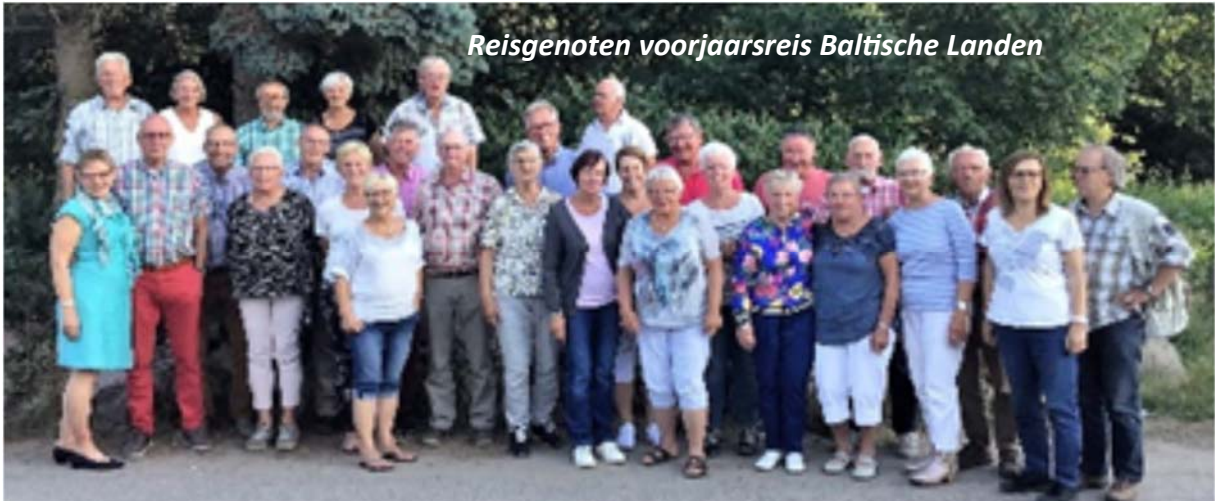
Reisgenoten voorjaarsreis Baltische Landen